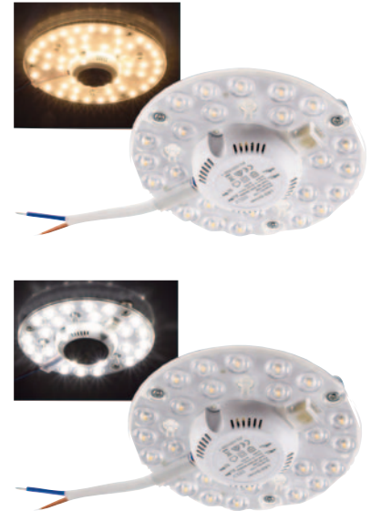
Hält per Magnet

LED-Umrüstmodul für Decken oder Wandleuchten mit herkömmlichen Leuchtmitteln. Ideal auch zum Austausch Ihrer defekten LED Beleuchtung. So einfach wie nie ersetzen Sie die alte oder überholte Technik Ihrer vorhandenen Leuchte. Das Modul wird direkt in der Leuchte an 230V angeschlossen. Die Befestigung ist superleicht per Magnet (für Leuchten mit Metallkörper) in wenigen Sekunden erledigt..